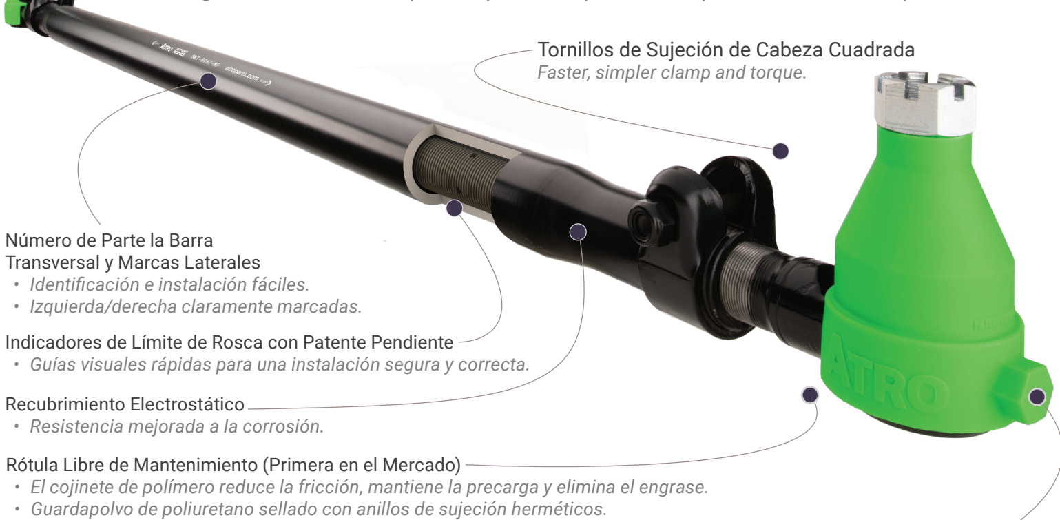
Tornillos de Sujeción de Cabeza Cuadrada Faster, simpler clamp and torque.

De los expertos en Pernos de Dirección, aquí está el nuevo estándar en Barras de Dirección. Tecnología de instalación con patente pendiente para un tiempo de servicio más rápido.