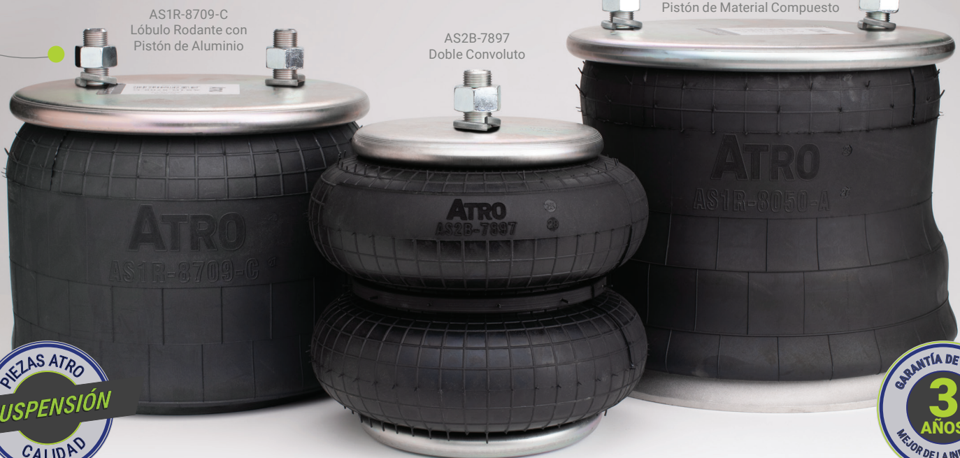
AS1R-8709-C Lóbulo Rodante con Pistón de Aluminio

Protectores de Rosca Instalación limpia y fácil.